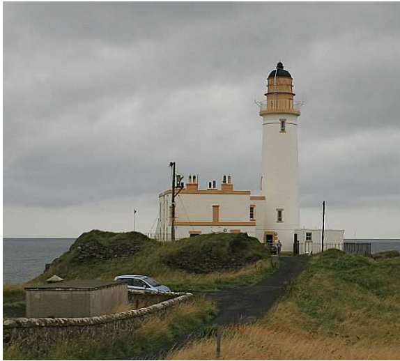
Turnberry Lighthouse ILLW UK0000

Vor ein paar Jahren hat der Internationale Verband der Leuchtturmwächter beschlossen, einen jährlichen Tag der offenen Tür für Leuchttürme auf der ganzen Welt zu veranstalten, um die Besucher zu ermutigen, ihre Leuchttürme zu besuchen. Sie kamen zu dem Schluss, dass die Kombination mit dem bestehenden ILLW-Event sehr sinnvoll war und dieser Schritt sehr erfolgreich war, da die Medien in einigen der teilnehmenden Länder involviert waren.