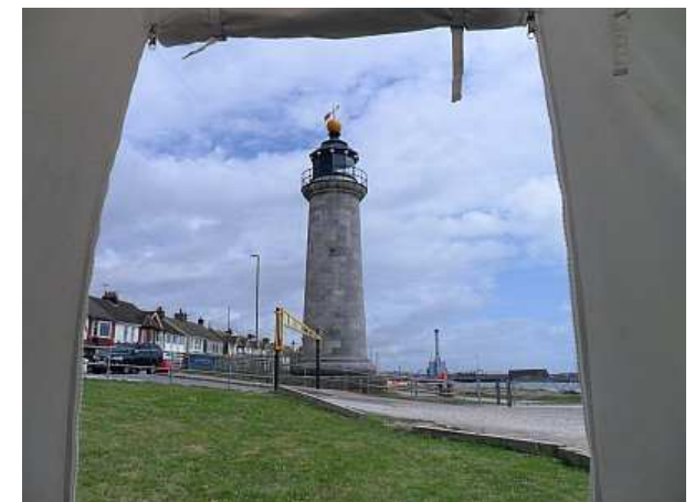
Shoreham Lighthouse, Süd-England.

Der Monat August scheint der internationale Monat für das Feiern von Leuchttürmen geworden zu sein. Länder auf der ganzen Welt sind in die eine oder andere mit dem Leuchtturm verbundene Aktivität involviert. Vor einigen Jahren erklärte der Kongress der Vereinigten Staaten den 7. August zum National Lighthouse Day, und in der ersten Augustwoche errichteten Amateurfunker in Amerika tragbare Stationen in Leuchttürmen und bemühten sich, miteinander in Kontakt zu treten. Im Gegensatz zum ILLW-Event werden Preise und Zertifikate für die NLD vergeben.